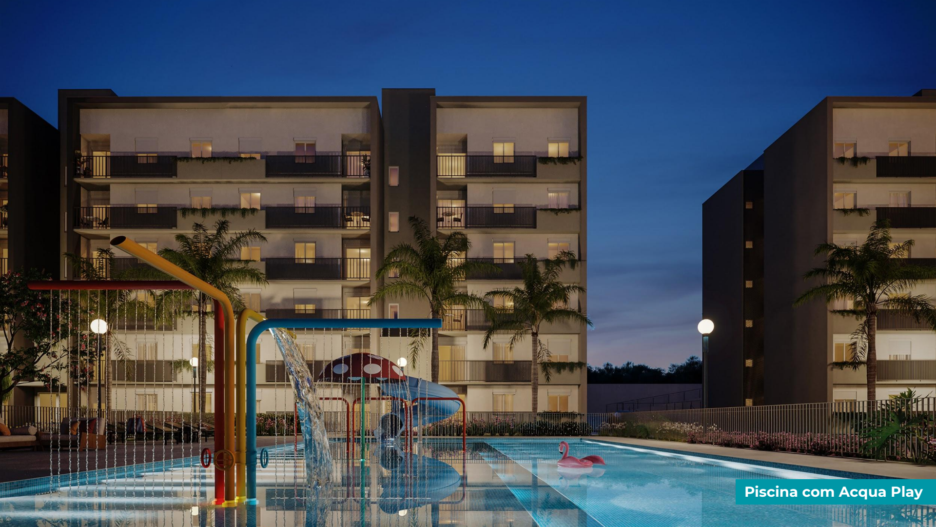
Piscina com Acqua Play