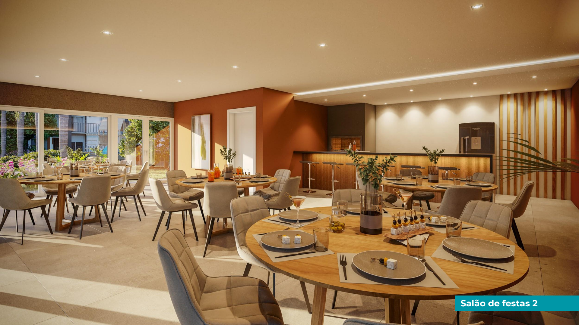
Salão de festas 2