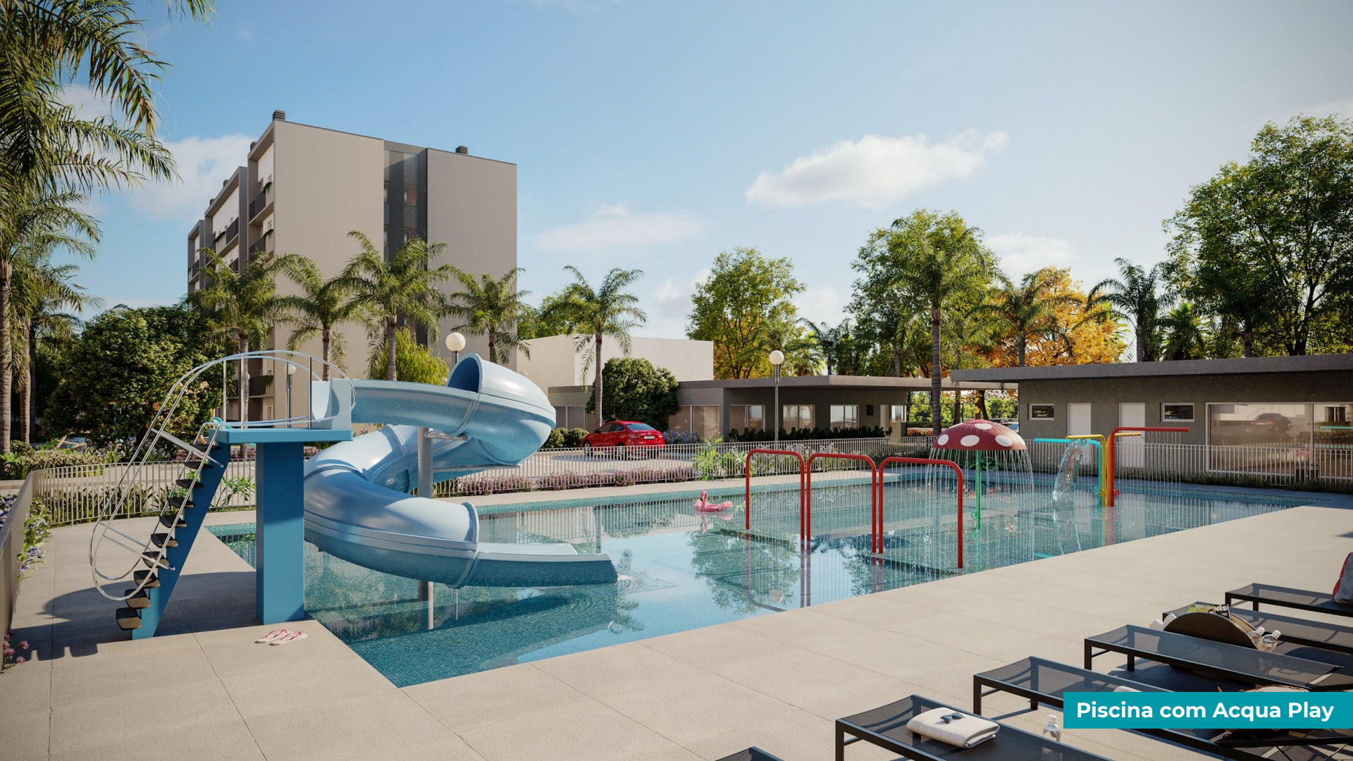
Piscina com Acqua Play