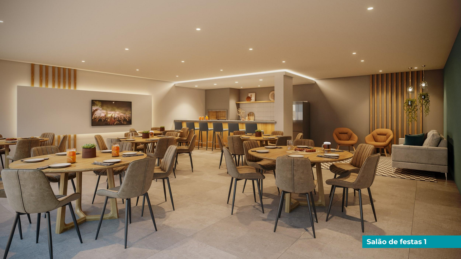
Salão de festas 1